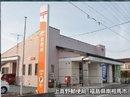
上真野郵便局 (福島県南相馬市)