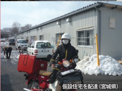
仮設住宅を配達 (宮城県)