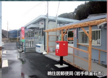
鶴住居郵便局 (岩手県釜石市)