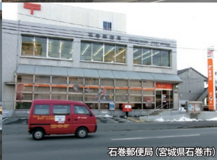
石巻郵便局 (宮城県石巻市)