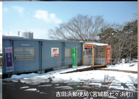
吉田浜郵便局 (宮城県七ヶ浜町)